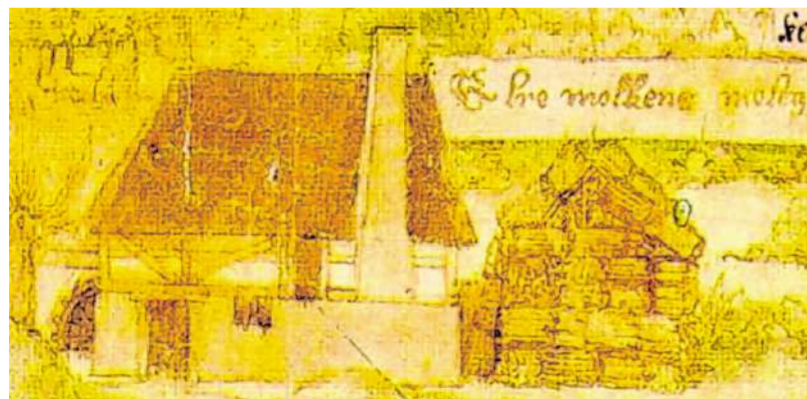
Die alten Mühlen in Stolberg entlang der Vicht sind bereits auf sehr alten Bildern zu sehen.