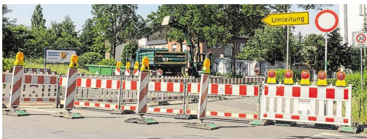
Die Buschstraße wird wegen der Verlegung einer Gasleitung und damit verbundenen Erdbewegungen voll gesperrt.

Die Umleitungsstrecke führt die Verkehrsteilnehmer über Schloßberg, Cockerillstraße, Heinrichstraße und Buschstraße und umgekehrt und ist entsprechend ausgeschildert.