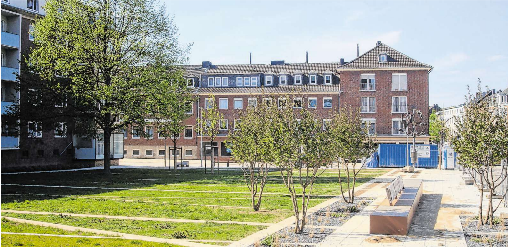
Auf historischen Abbildungen aus Stolberg ist auch oft der Sayette-Garten zu sehen. Das Areal wurde 2017 überholt und neu angelegt. Der Garten ist heute ein besonderer Blickfang der Stadt.