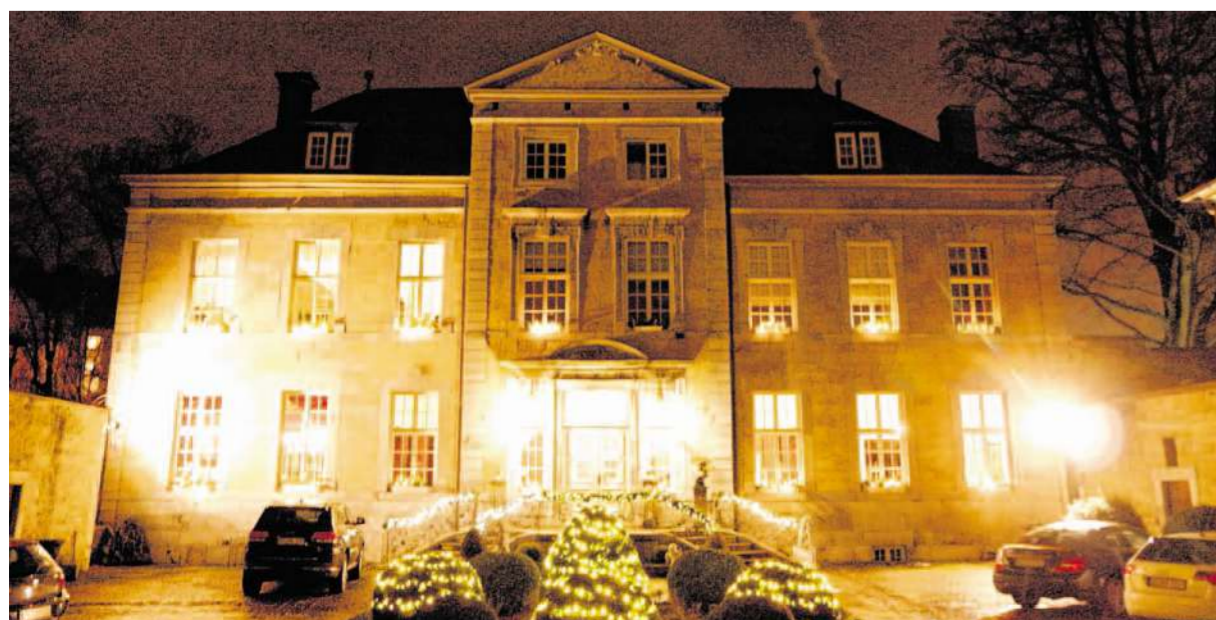
Auch privates Engagement soll generiert werden: Die Beleuchtung beispielsweise des Kupferhofes Rosental inklusive der Werkhöfe und des Baumbestandes soll weiter ausgebaut werden.

Lokalredaktion Tel. 0 24 02 / 1 26 00-30 Fax 0 24 02 / 1 26 00-49 E-Mail: lokales-stolberg@zeitungsverlag-aachen.de Jürgen Lange (verantwortlich), Sarah-Lena Gombert, Ottmar Hansen Englerthstraße 18, 52249 Eschweiler Leserservice: Tel. 0241 / 5101-701 Fax 0241 / 5101-790 Kundenservice Medienhaus vor Ort: Bücherstube am Rathaus (mit Ticketverkauf) Rathausstraße 4, 52222 Stolberg Öffnungszeiten: Mo. bis Fr. 9.00 bis 18.30 Uhr, Sa. 9.00 bis 14.00 Uhr